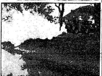
Brand? - Neen, een demonstratie in het leggen van een well-insulatie met de TIFA-Mistblower in het kanaal langs de Madoeroeweg.

DEK 1 - APDK II. In deze wedstrijd hebben de spelers van het eerste elftal het beste resultaat behaald. De wedstrijd werd gewonnen door de spelers van de eerste elftal met een verschil van 1-0.